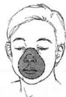
Ilustración 6. Colocación correcta de mascarilla facial