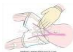
Ilustración 4. Valoración pulso femoral