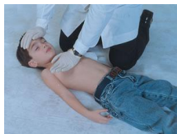
Ilustración 2. Valoración de respuesta

Si no hay respuesta y no respira, o sólo jadea/boquea, grite pidiendo ayuda.