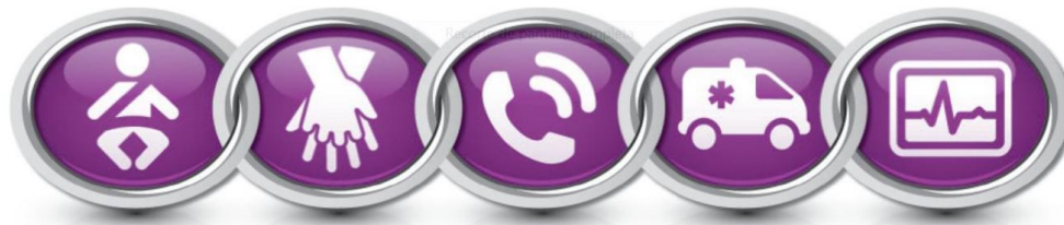
Ilustración 1. Cadena de supervivencia pediátrica