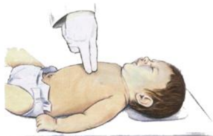
Ilustración 9. Técnica de compresión torácica con dedos en lactantes