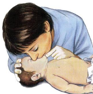
Ilustración 10. Ventilaciones de boca a boca-nariz en lactantes