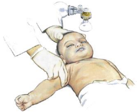
Ilustración 8. Detección de pulso en arteria braquial