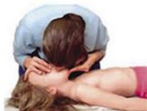
Ilustración 7. Ventilación boca a boca