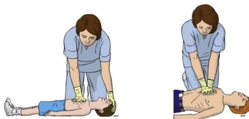
Ilustración 5. Técnica de compresiones torácicas en niños